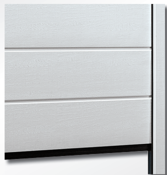
Zevně RAL 9010

S oboustranným základním polyesterovým nástřikem: