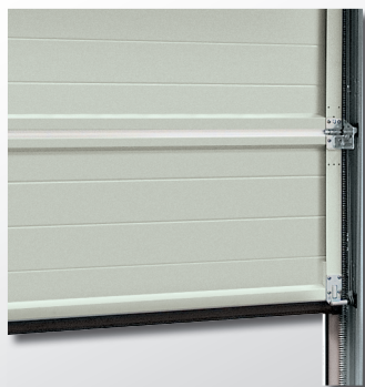
Zevnitř RAL 9002